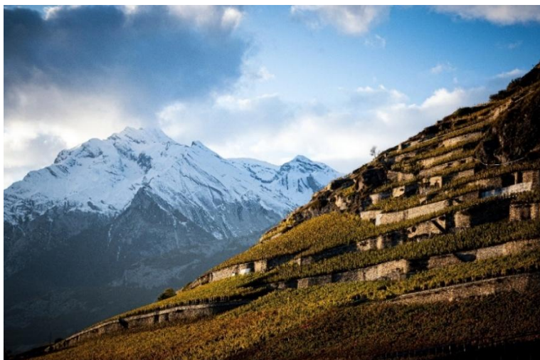
Vignoble en terrasses sur les côtes de Sion